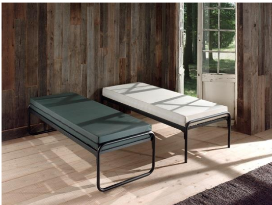
Bed met matras