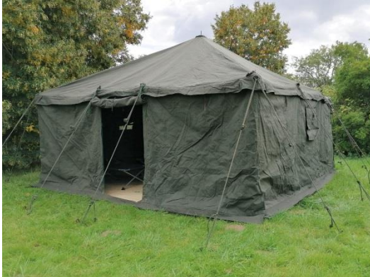
Tent 10 pers.

Domein Beukenhof (Tafeltenniscentrum TTC Hasselt)