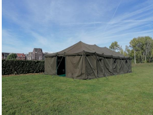
Tent 20 pers.